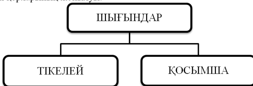
Сурет 1. Экономикалық және материалдық шығындар

Қосымша экономикалық және материалдық шығындарға жататындар: