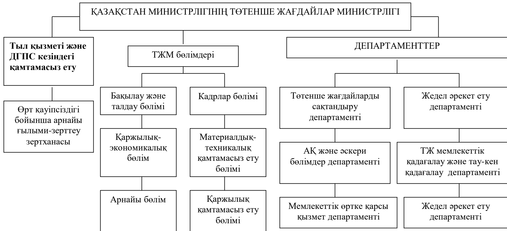
3-сурет – Қазақстан Республикасының Төтенше жағдайлар министрлігінің құрылымы